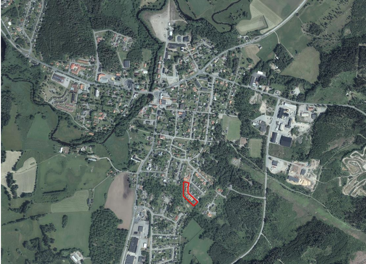
Figur 2 Markerat planområde på karta

Den idag befintliga kvartersmarken inom planområdet, Gästgivaregården 1:272 till Gästgivaregården 1:277, är privatägda och den idag befintliga allmänna platsmarken inom planområdet, Gästgivaregården 1:96, ägs av Sävsjö kommun.