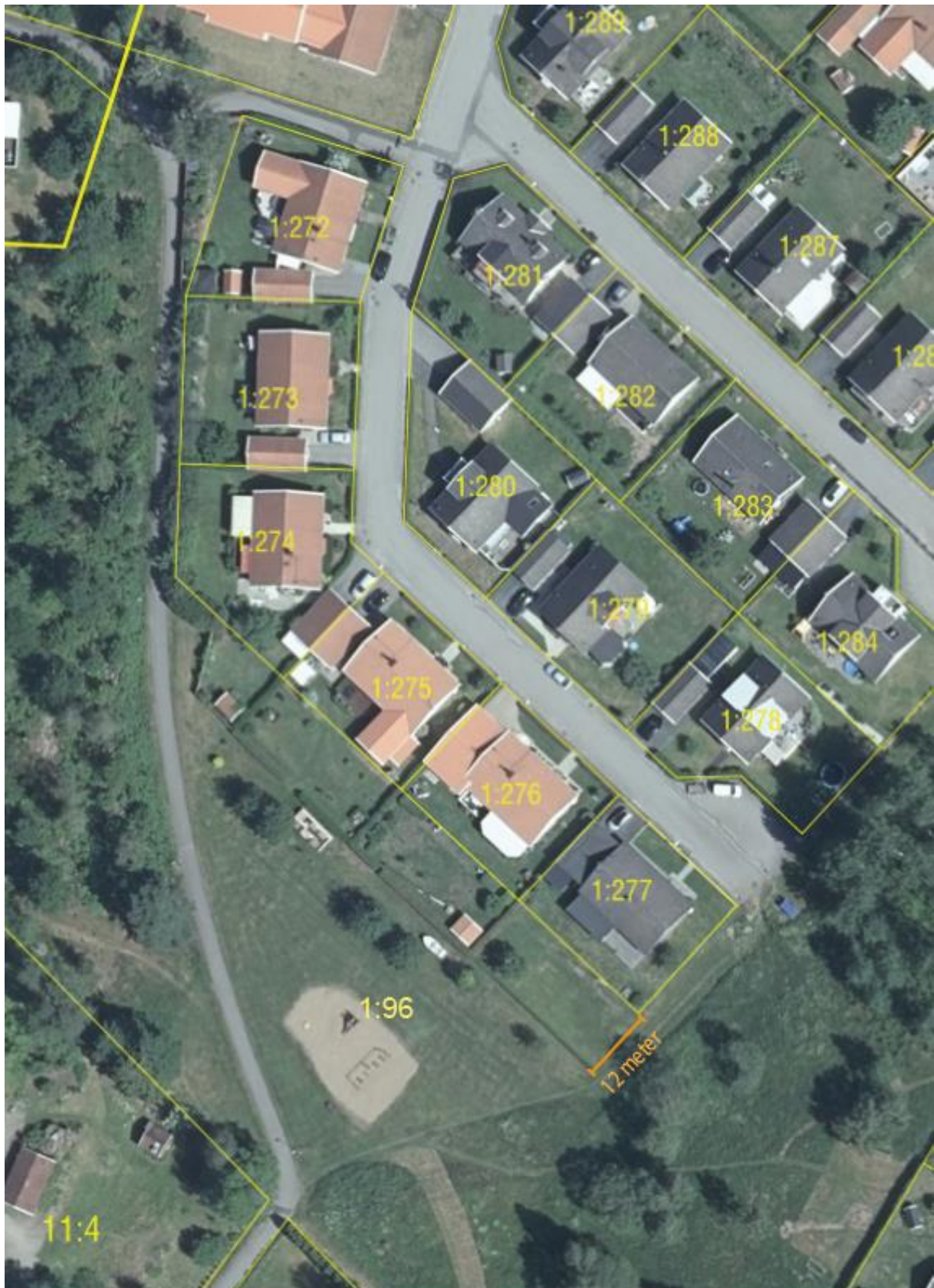
Figur 3 Beskrivande bild över tomtutökning